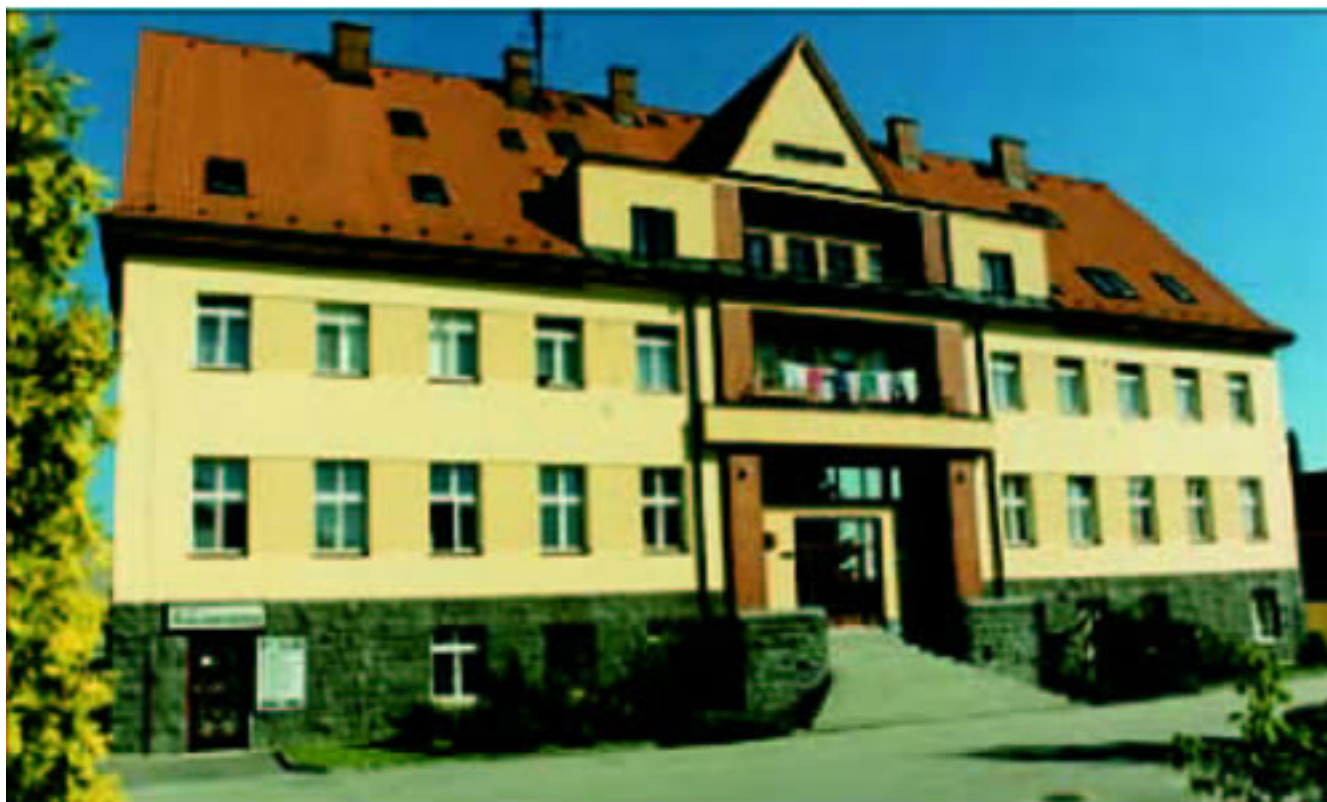
sídlo Lesního družstva obcí v Přibyslavi